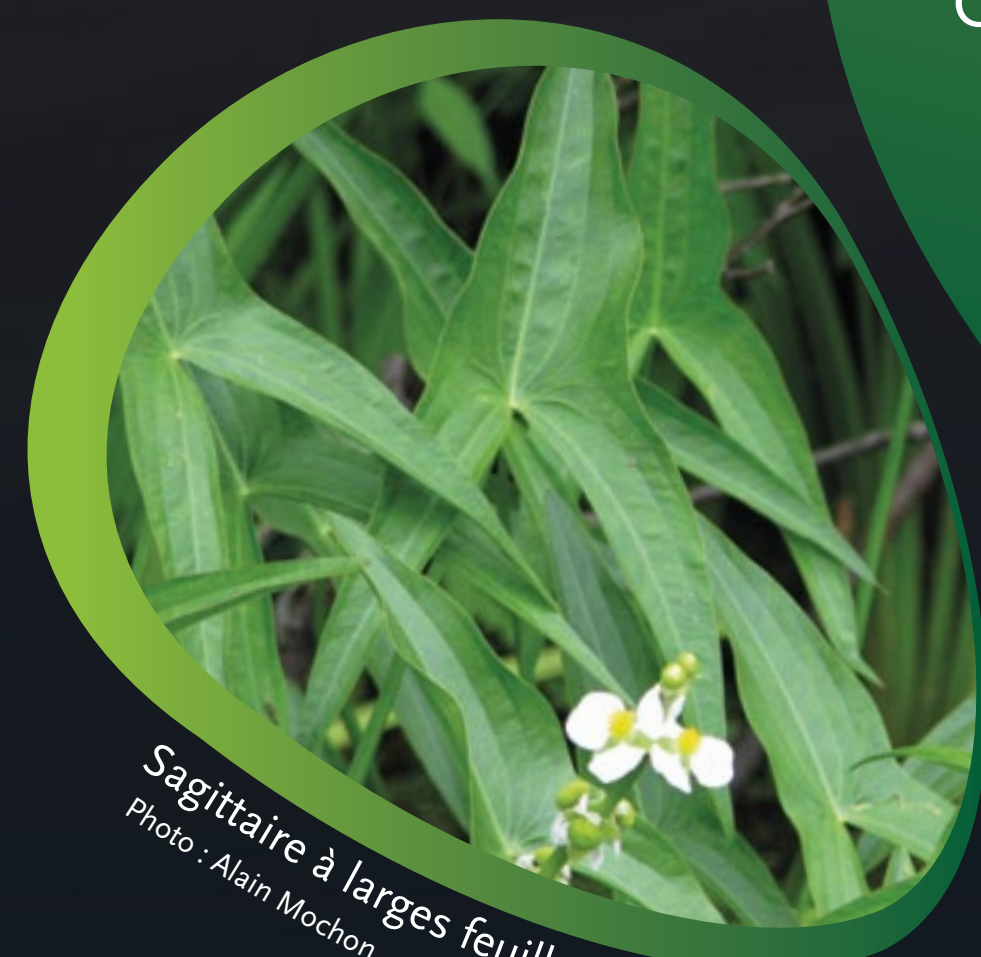
Sagittaire à larges feuilles

Ces milieux offrent des « services » essentiels... Ils contribuent à améliorer la qualité de l'eau en jouant un rôle de filtre qui retient les matières en suspension et absorbe les nutriments. Ils réduisent également les risques d'inondations en ralentissant la vitesse d'écoulement des eaux et en retenant les pluies en période de pointe. Ces fonctions de régulation profitent indirectement au bien-être humain.