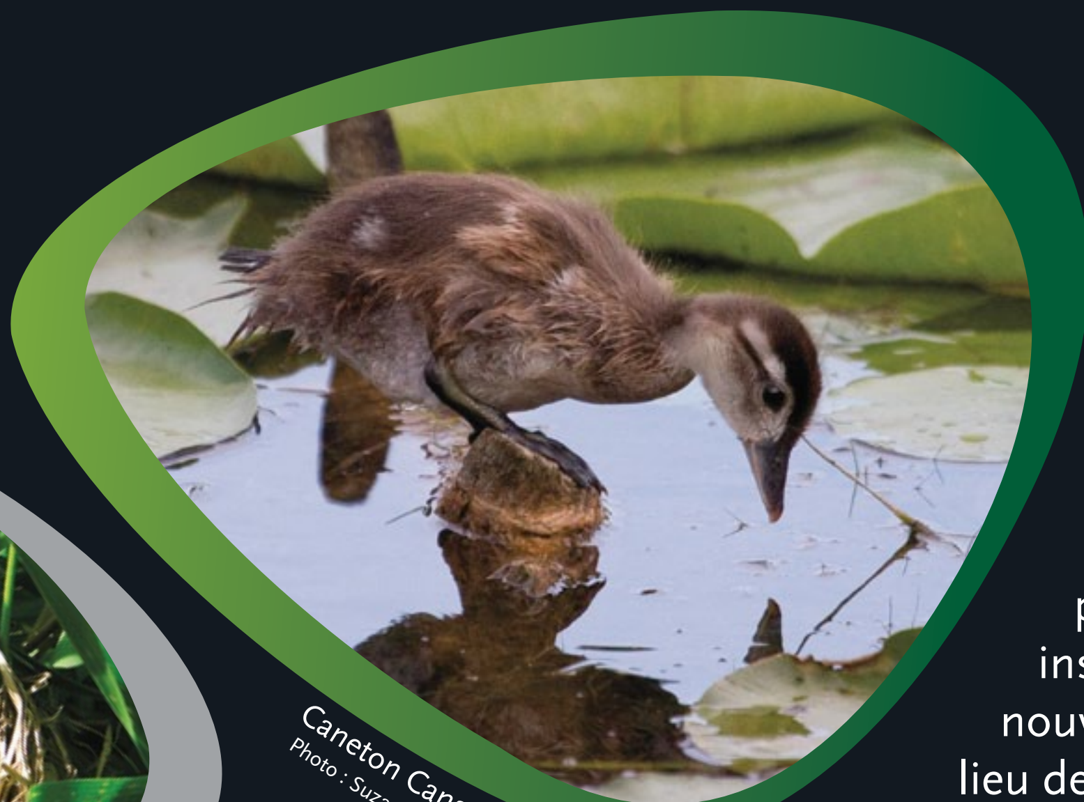
Caneton Canard branchu