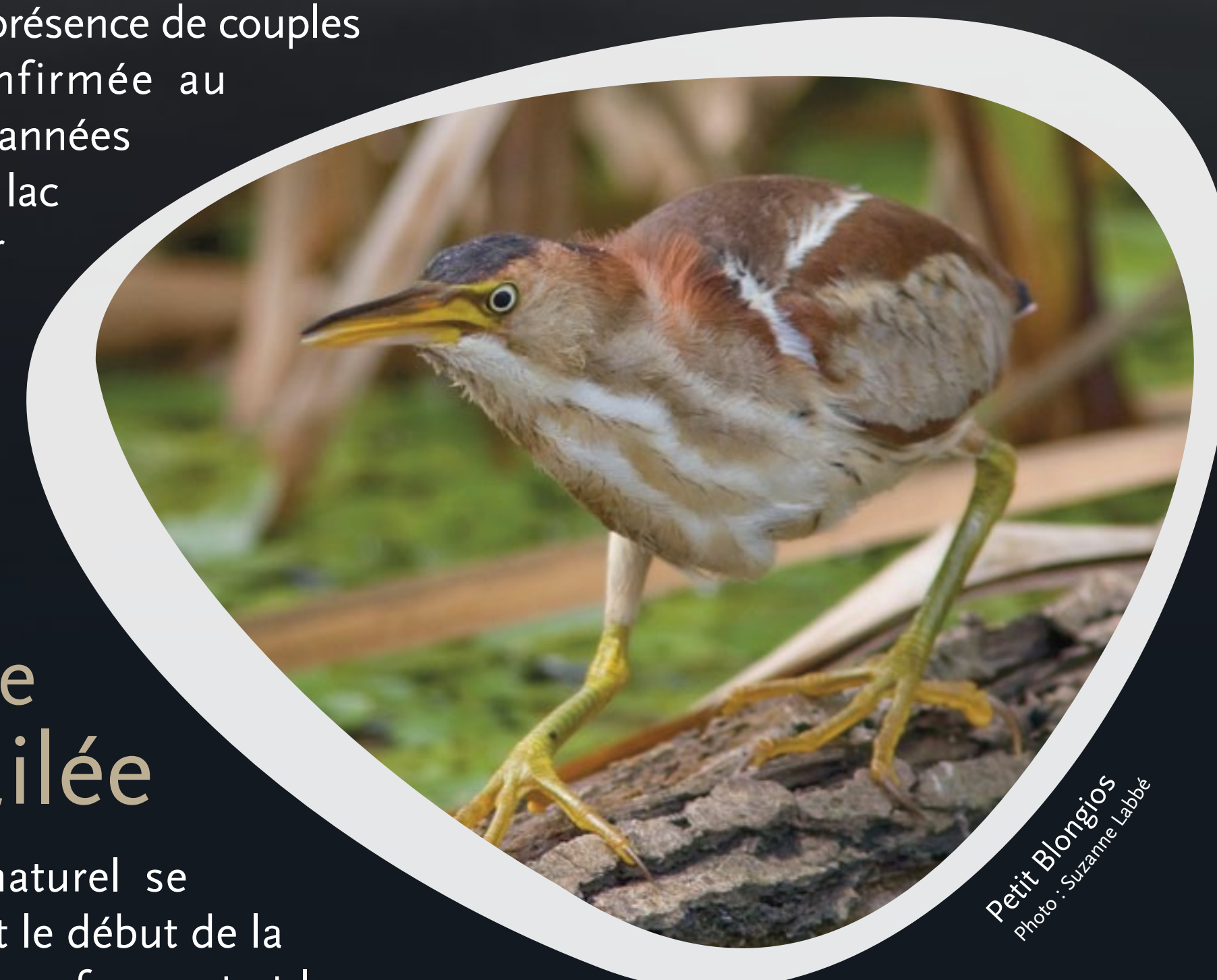
Petit Blongios

Bonne nouvelle ! La présence de couples nicheurs a été confirmée au cours des dernières années dans les marais du lac Boivin et du corridor naturel de la rivière Yamaska Nord.