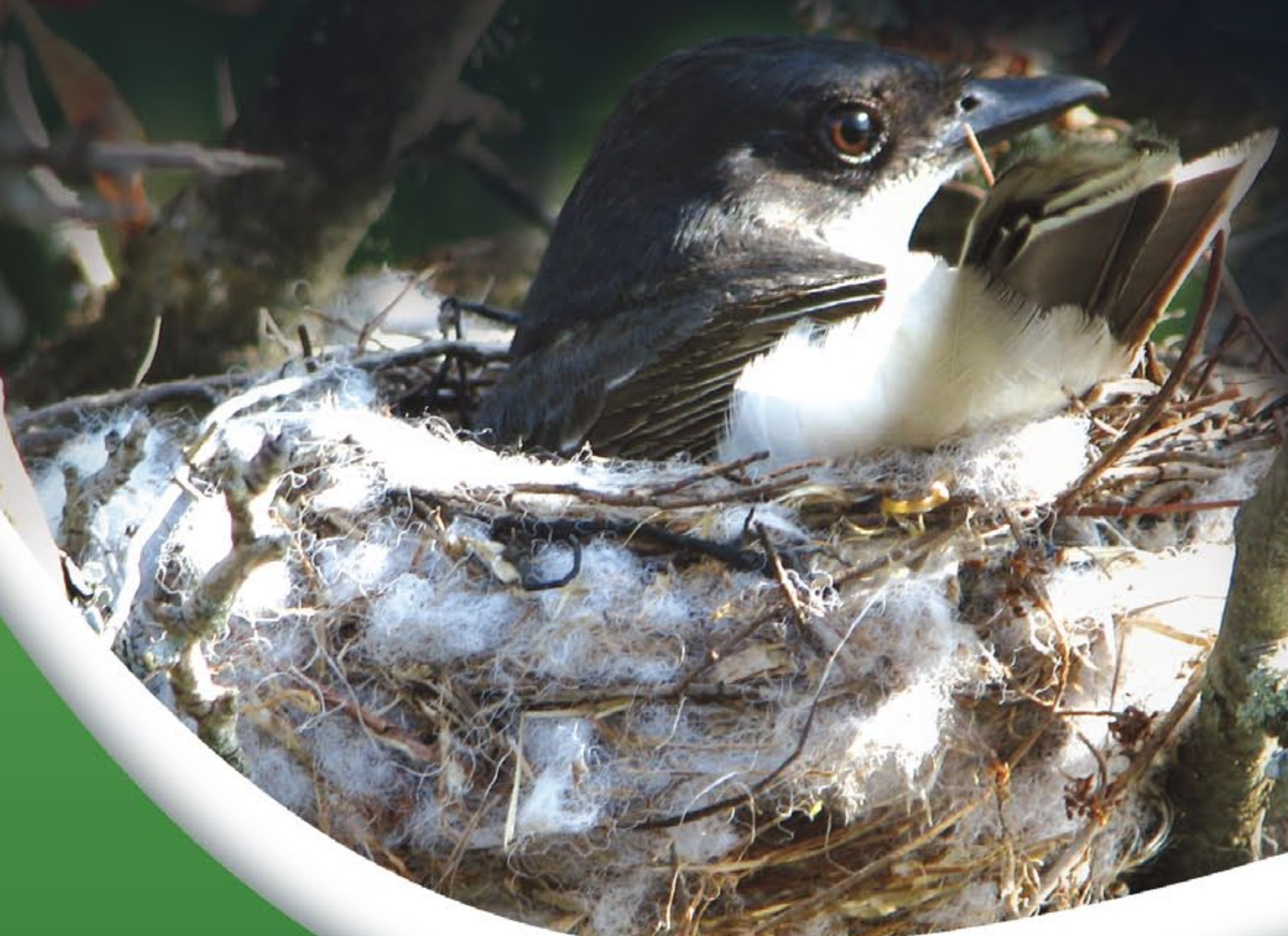
Tyrann tritri sur son nid

Près d'une centaine d'espèces d'oiseaux nichent dans le corridor naturel. Ce riche écosystème constitue à juste titre une véritable pouponnière d'importance régionale pour la faune ailée. Un paradis de l'ornithologie.