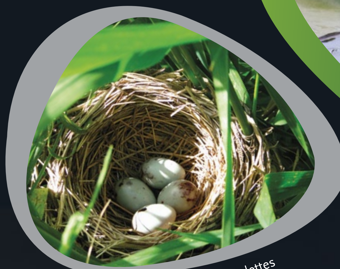
Nid de Carouge à épaulettes