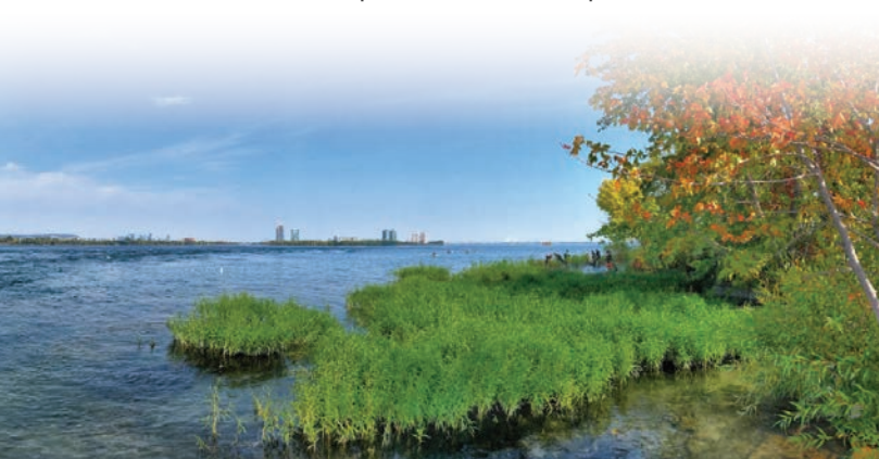
Conservation et mise en valeur de la carmantine d'Amérique à l'île Rock au sud de Montréal