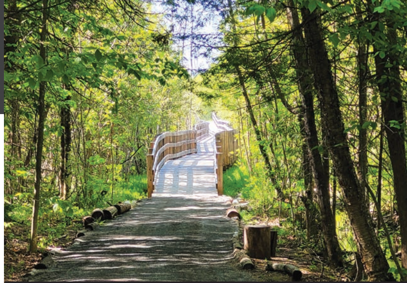
Aménagement et mise en valeur du futur parc de la Forêt-Boucher