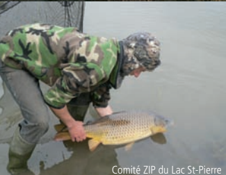
Comité ZIP du Lac St-Pierre