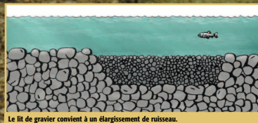
Le lit de gravier convient à un élargissement de ruisseau.

L'aménagement ou la restauration d'une frayère vise l'amélioration des conditions de reproduction. Le cours d'eau doit être nettoyé et exempt de débris. Il faut ensuite choisir l'emplacement qui réunit le plus de conditions de succès et vérifier si d'autres aménagements (seuils, fosses, abris, etc.) sont nécessaires à proximité. Le choix de la technique appropriée se fait ensuite en fonction des caractéristiques du cours d'eau.