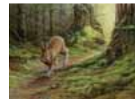
Le tapis vert, de Pierre Leduc

Procurez-vous la reproduction à tirage limité 2005, Le tapis vert , de Pierre Leduc, dès décembre 2004 ! Le prix de la reproduction (non encadrée) est de 149,53$* (taxes et manutention incluses). Voyez notre collection sur le site Internet.