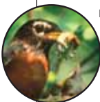
Photo de la page couverture : Denis Faucher, Merle d'Amérique nourrissant son oisillon

Conception graphique et production (calendrier et bilan) : Siamois graphisme