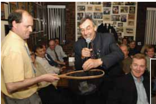
Un moment mémorable de cette soirée : l'encan chinois.