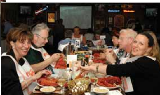
Le homard était à l'honneur chez Magnan !